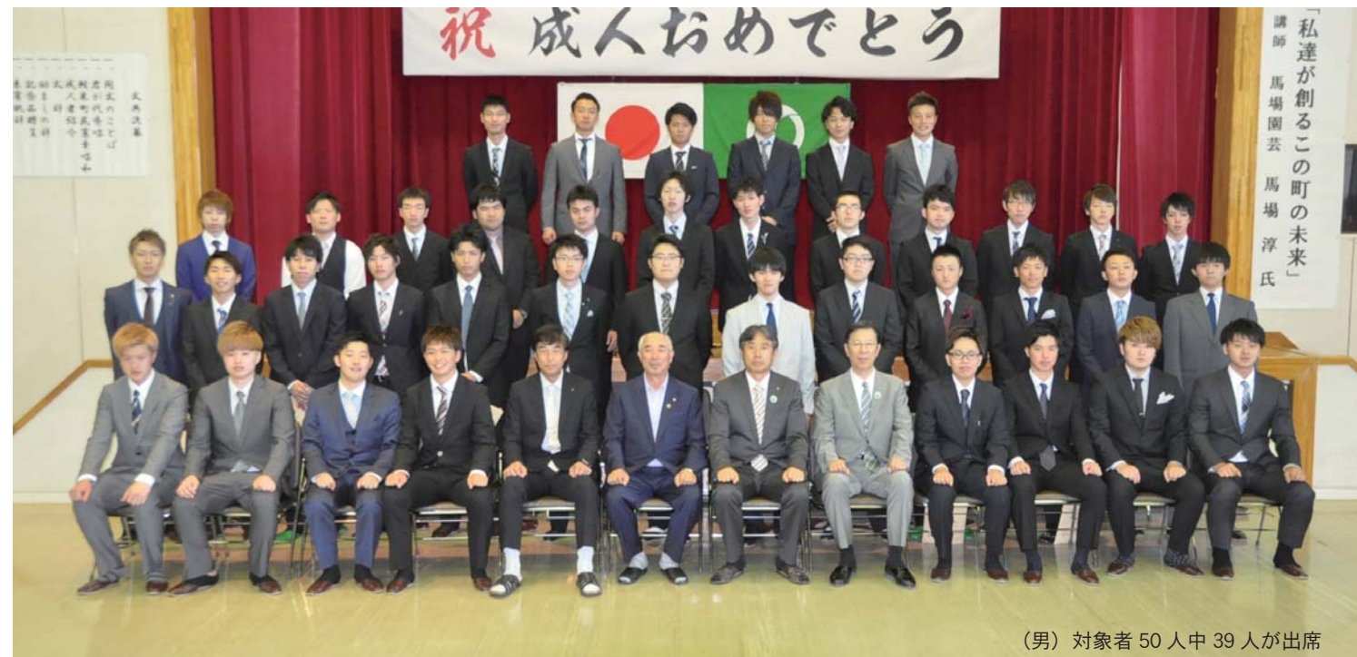
(男) 対象者 50 人中 39 人が出席