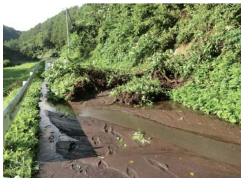
土砂の流出でふさがれた道路

した。 今回の台風による被害額などは確認中です。家屋や農作物に被害を受けた方は役場の各担当課までご連絡ください。 被害の種類と問い合わせ先 家屋の被害：町民生活課 ☎46-4734 農作物の被害：産業振興課 ☎46-4739 その他の被害など：総務課 ☎46-4738