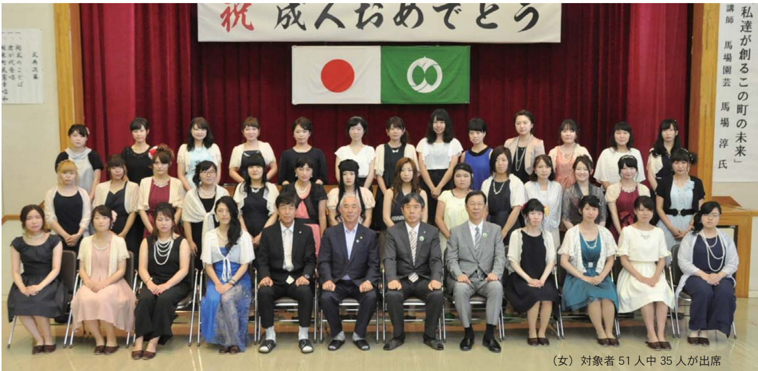
(女) 対象者 51 人中 35 人が出席