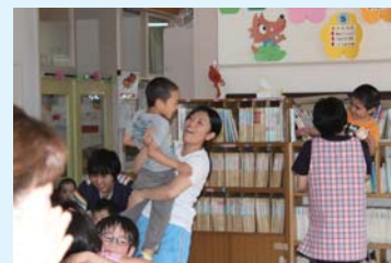
奥 亜香音 小軽米保育園

自動車に興味があり、また、進路に役立てたいと思いましたが、洗車など、自動車を傷つけないよう慎重に行う作業が特に大変でした。