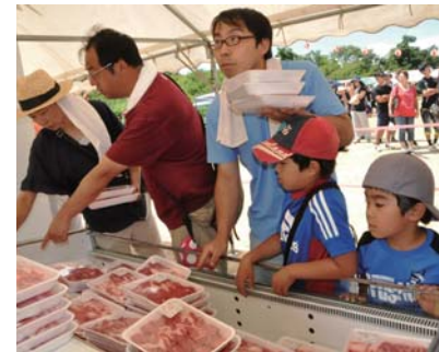
おいしいお肉を求めて 後方にも長い行列が