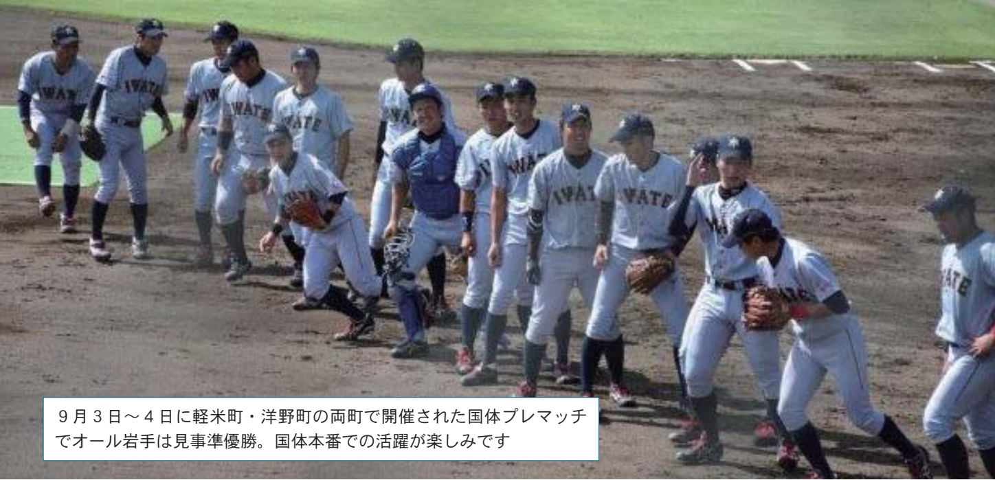
9月3日～4日に軽米町・洋野町の両町で開催された国体プレマッチでオール岩手は見事準優勝。国体本番での活躍が楽しみです