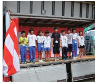
小軽米小学校児童による 開会の言葉