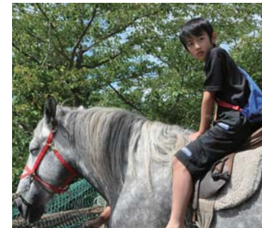
乗馬体験や牛の乳しぼり体験 もありました