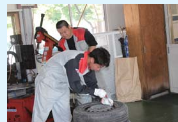
於本 紳也 高常自動車工業株式会社

将来食に関する職業に就きたいのでここで学ぼうと思いました。一度にたくさんのケーキを運ぶなど、思っていたよりたくさん力仕事があるので大変です。