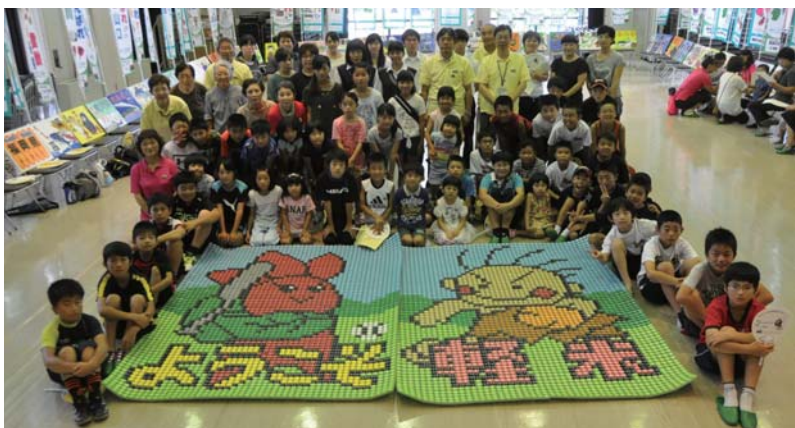
高さ2メートル以上の大きなパネルが完成。参加者のみんなで記念撮影。

全国から来る選手たちをおもてなししようと、ペットボトルのキャップを使用した大きな歓迎パネルづくりが8月20日に農