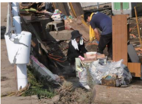
家屋への浸水被害