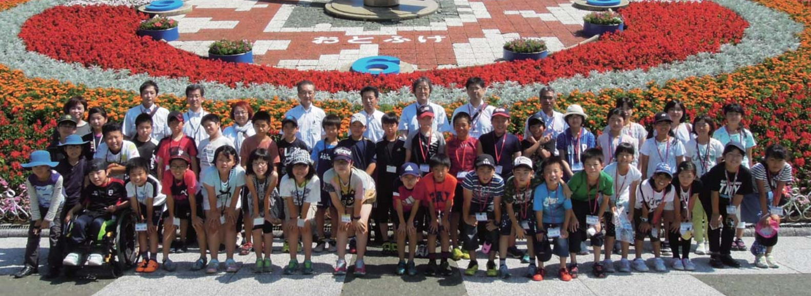
歓迎式終了後、音更町の子もたちと記念撮影（十勝が丘公園花時計前）